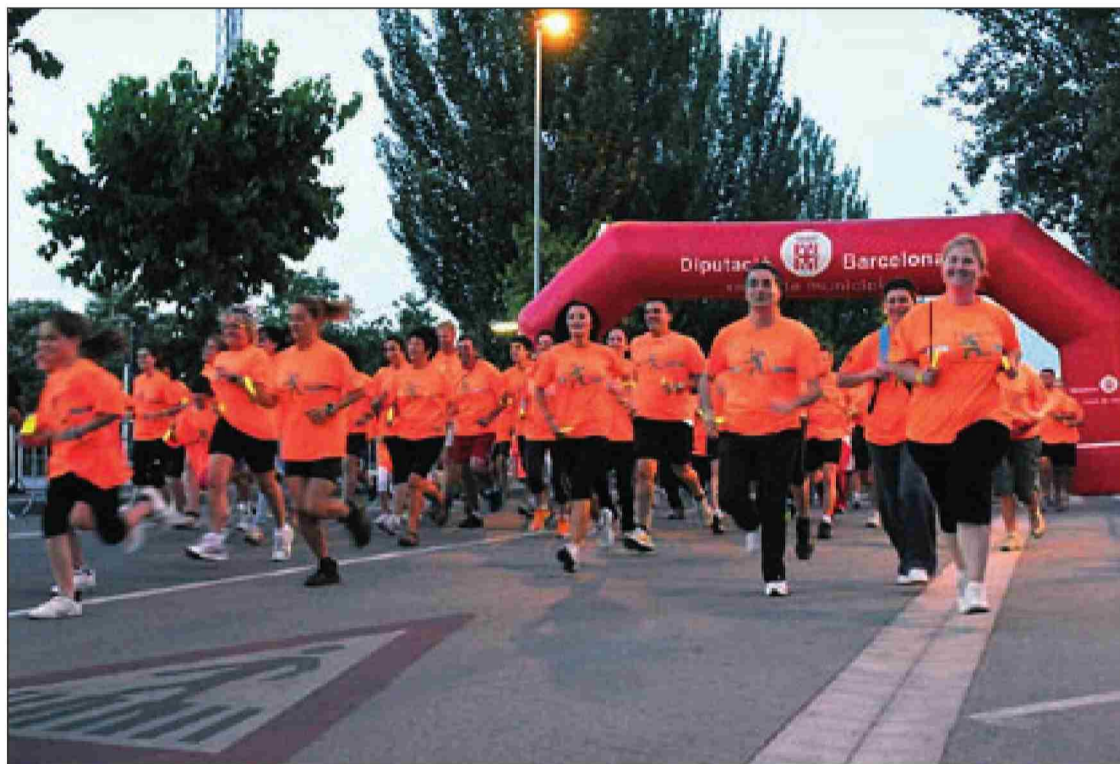
La fórmula exitosa de la Cursa de les Torxes s'ampliarà amb un segon circuit per a corredors més experimentats