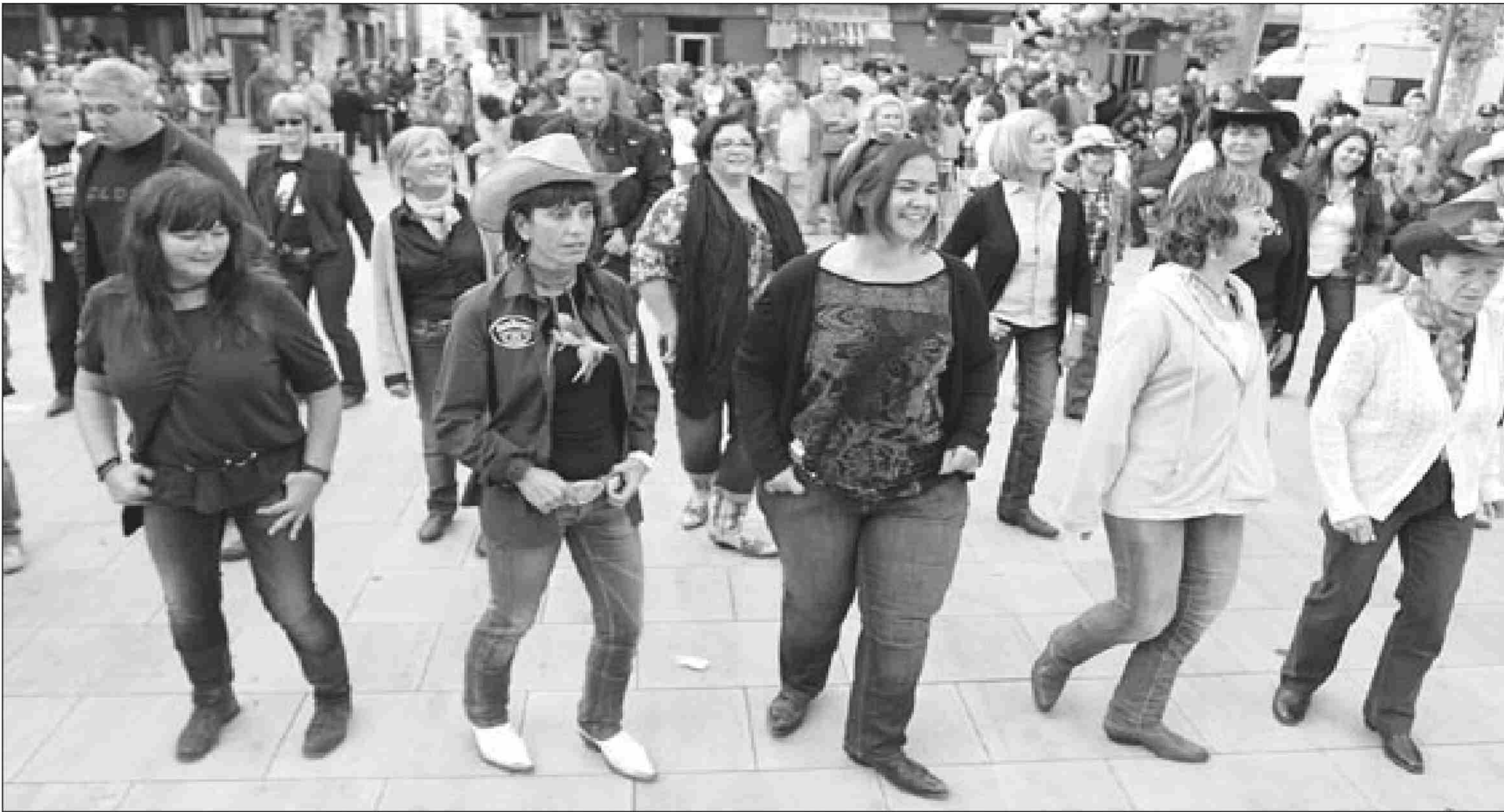
Una ballada de 'country' aquest dissabte a la tarda a la plaça de l'Ajuntament de Palautordera